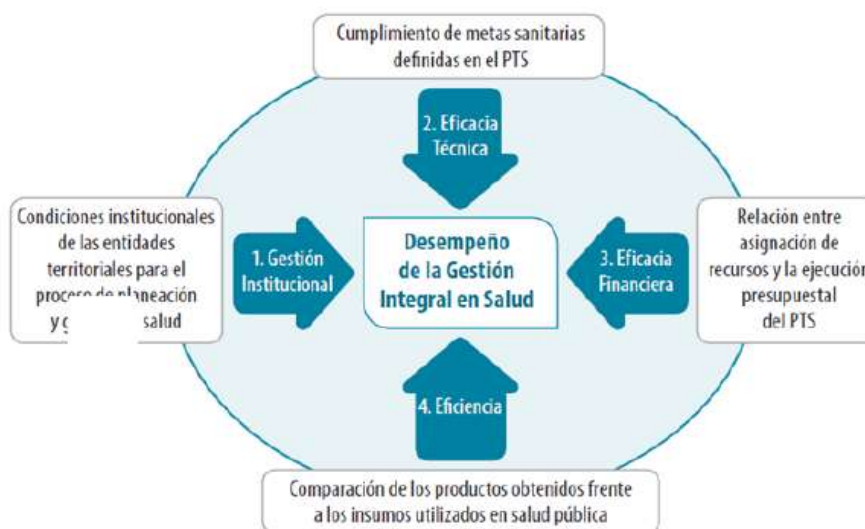
ESQUEMA 3. Esquema de Medición del Desempeño de la Gestión Integral en Salud en las Entidades Territoriales (GIS)

“La metodología de monitoreo y evaluación de los PTS establecida por el Ministerio de Salud y Protección Social plantea la medición del desempeño de la Gestión Integral en Salud de las Entidades Territoriales a través del análisis de los siguientes componentes: a) Gestión institucional, b) Eficacia técnica, c) Eficacia financiera y d) Eficiencia, tal como se muestra en el siguiente esquema:”