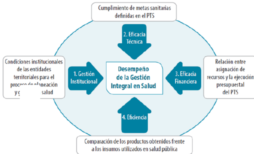
ESQUEMA 3. Esquema de Medición del Desempeño de la Gestión Integral en Salud en las Entidades Territoriales (GIS)