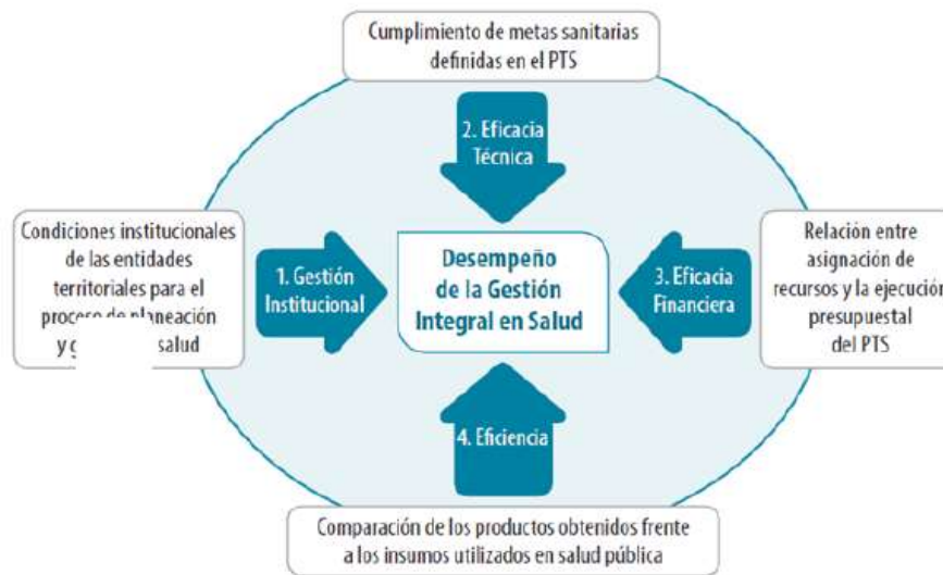
ESQUEMA 3. Esquema de Medición del Desempeño de la Gestión Integral en Salud en las Entidades Territoriales (GIS)

“La metodología de monitoreo y evaluación de los PTS establecida por el Ministerio de Salud y Protección Social plantea la medición del desempeño de la Gestión Integral en Salud de las Entidades Territoriales a través del análisis de los siguientes componentes: a) Gestión institucional, b) Eficacia técnica, c) Eficacia financiera y d) Eficiencia, tal como se muestra en el siguiente esquema:”