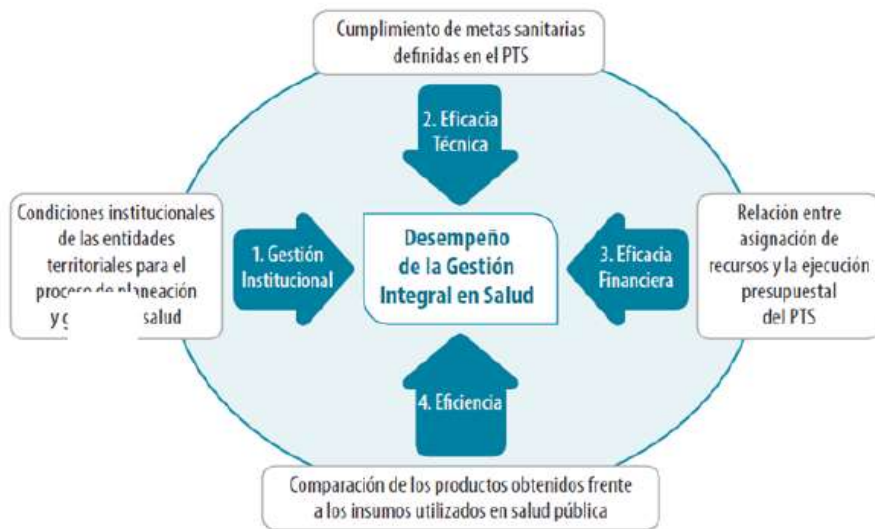
ESQUEMA 3. Esquema de Medición del Desempeño de la Gestión Integral en Salud en las Entidades Territoriales (GIS)

“La metodología de monitoreo y evaluación de los PTS establecida por el Ministerio de Salud y Protección Social plantea la medición del desempeño de la Gestión Integral en Salud de las Entidades Territoriales a través del análisis de los siguientes componentes: a) Gestión institucional, b) Eficacia técnica, c) Eficacia financiera y d) Eficiencia, tal como se muestra en el siguiente esquema:”