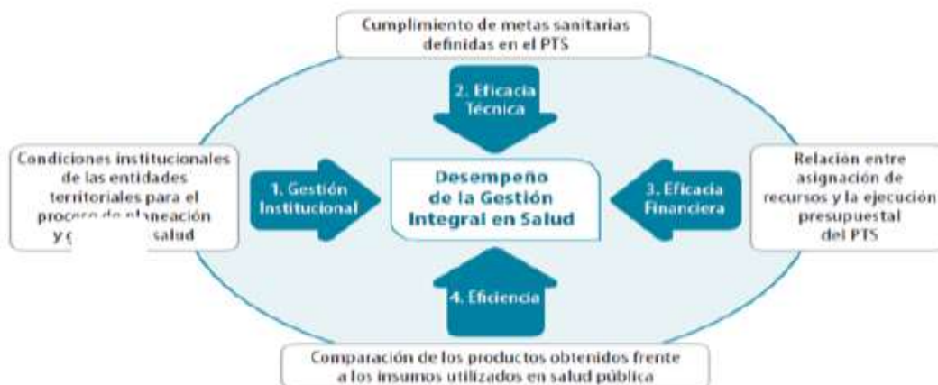
ESQUEMA 3. Esquema de Medición del Desempeño de la Gestión Integral en Salud en las Entidades Territoriales (GIS)

“La metodología de monitoreo y evaluación de los PTS establecida por el Ministerio de Salud y Protección Social plantea la medición del desempeño de la Gestión Integral en Salud de las Entidades Territoriales a través del análisis de los siguientes componentes: a) Gestión institucional, b) Eficacia técnica, c) Eficacia financiera y d) Eficiencia, tal como se muestra en el siguiente esquema:”