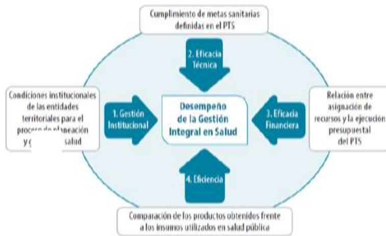
ESQUEMA 3. Esquema de Medición del Desempeño de la Gestión Integral en Salud en las Entidades Territoriales (GIS)

“La metodología de monitoreo y evaluación de los PTS establecida por el Ministerio de Salud y Protección Social plantea la medición del desempeño de la Gestión Integral en Salud de las Entidades Territoriales a través del análisis de los siguientes componentes: a) Gestión institucional, b) Eficacia técnica, c) Eficacia financiera y d) Eficiencia, tal como se muestra en el siguiente esquema:”