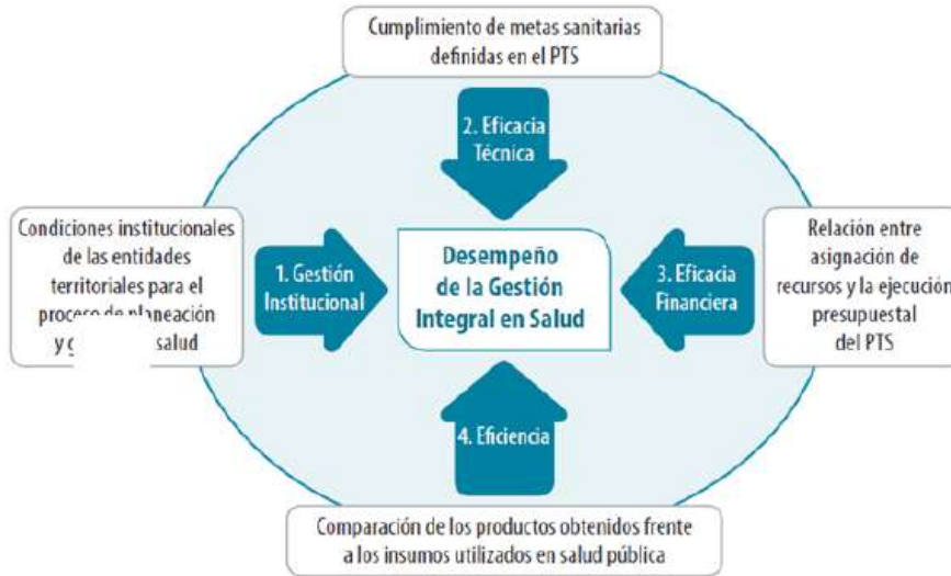
ESQUEMA 3. Esquema de Medición del Desempeño de la Gestión Integral en Salud en las Entidades Territoriales (GIS)

a) Gestión institucional, b) Eficacia técnica, c) Eficacia financiera y d) Eficiencia, tal como se muestra en el siguiente esquema:”