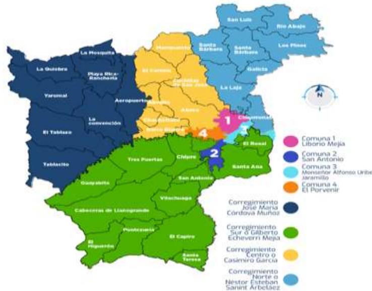
Mapa 1. División política administrativa y límites, del Municipio de Rionegro año 2023.