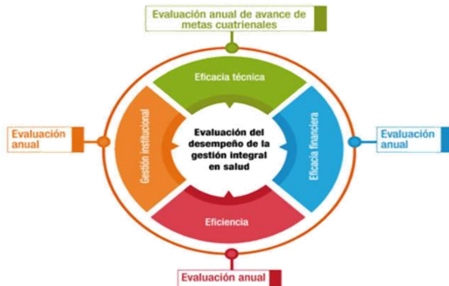
Esquema 1. Evaluación del desempeño de la gestión integral en salud.