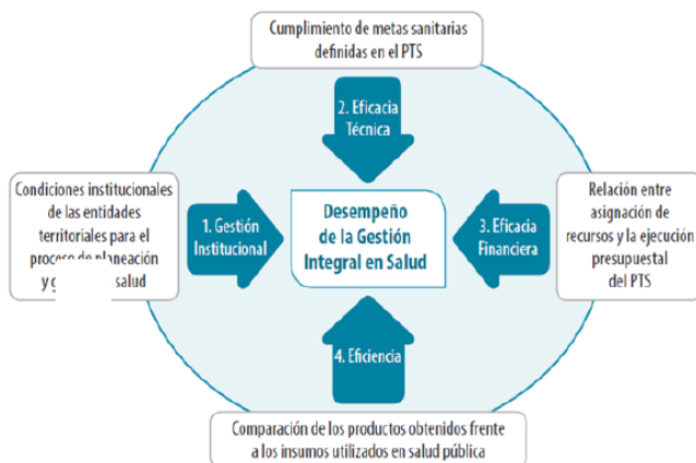
ESQUEMA 3. Esquema de Medición del Desempeño de la Gestión Integral en Salud en las Entidades Territoriales (GIS)

tal como se muestra en el siguiente esquema:”