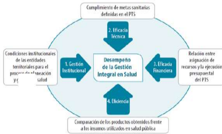
ESQUEMA 3. Esquema de Medición del Desempeño de la Gestión Integral en Salud en las Entidades Territoriales (GIS) 54

de los siguientes componentes: a) Gestión institucional, b) Eficacia técnica, c) Eficacia financiera y d) Eficiencia, tal como se muestra en el siguiente esquema.”