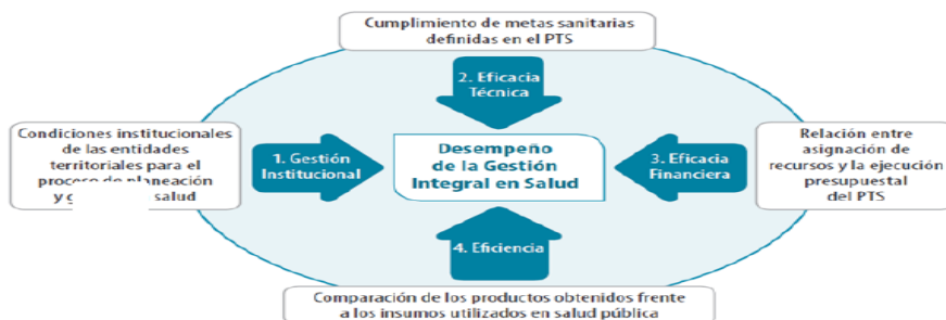
ESQUEMA 3. Esquema de Medición del Desempeño de la Gestión Integral en Salud en las Entidades Territoriales (GIS)

“La metodología de monitoreo y evaluación de los PTS establecida por el Ministerio de Salud y Protección Social plantea la medición del desempeño de la Gestión Integral en Salud de las Entidades Territoriales a través del análisis de los siguientes componentes: a) Gestión institucional, b) Eficacia técnica, c) Eficacia financiera y d) Eficiencia, tal como se muestra en el siguiente esquema.”