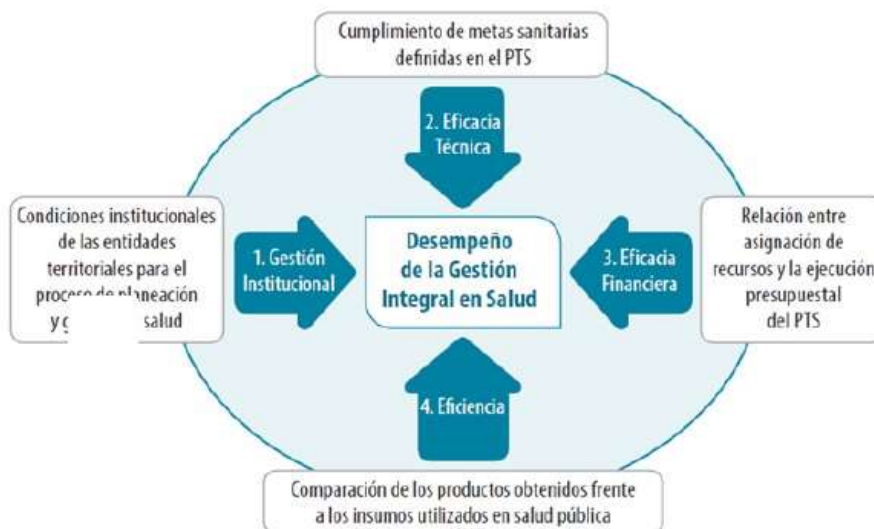
ESQUEMA 3. Esquema de Medición del Desempeño de la Gestión Integral en Salud en las Entidades Territoriales (GIS)