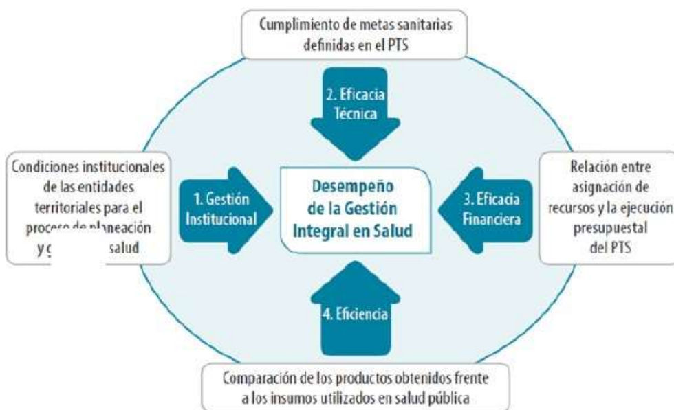
ESQUEMA 3. Esquema de Medición del Desempeño de la Gestión Integral en Salud en las Entidades Territoriales (GIS)