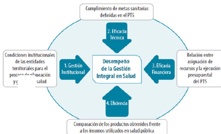
ESQUEMA 3. Esquema de Medición del Desempeño de la Gestión Integral en Salud en las Entidades Territoriales (GIS)