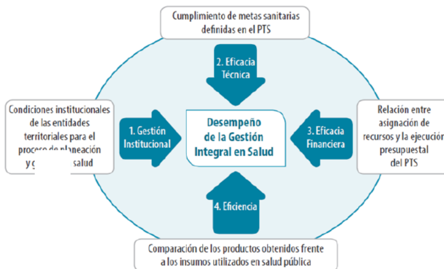
ESQUEMA 3. Esquema de Medición del Desempeño de la Gestión Integral en Salud en las Entidades Territoriales (GIS)

Casa de Gobierno Pedro Orozco Ocampo / Calle 10 # 9-51 / CP 056020 / Teléfono (604) 590 6968 / NIT. 890.981.238-3