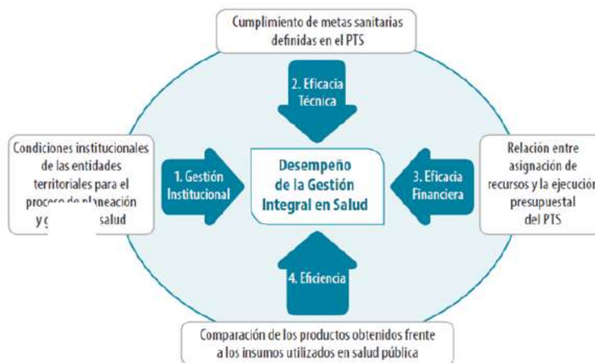
ESQUEMA 3. Esquema de Medición del Desempeño de la Gestión Integral en Salud en las Entidades Territoriales (GIS)

A su vez, la metodología define dos momentos para la medición de la gestión integral en salud: 1. Monitoreo trimestral a la gestión operativa del PTS, y 2. Evaluación anual y avance de las metas cuatrienales definidas en el PTS2. Para efectos de la evaluación de las metas sanitarias definidas en los PTS, las presentes orientaciones hacen énfasis en la medición del componente de eficacia técnica, a través del cual se “mide el nivel de cumplimiento de las metas sanitarias definidas en el Plan Territorial en Salud, al comparar lo realizado con lo programado en cada vigencia” (Ministerio de Salud y Protección Social, 2015, pág. 46). Eficacia operativa: Corresponde al monitoreo (seguimiento) trimestral y anual que se realiza a las actividades programadas en el Plan de Acción en Salud y que se visualiza a través de tableros de control dispuestos para la consulta en la página web del Ministerio, en el portal web dispuesto para tal fin. De esta manera, la medición de la eficacia operativa del PTS resulta de “calcular el promedio simple del porcentaje de cumplimiento de las actividades programadas trimestral y anualmente en el Plan de Acción en Salud en cada una de las líneas operativas del PDSP: promoción de la salud, gestión de riesgo en salud y gestión de la salud pública” (Ministerio de Salud y Protección Social, 2015, pág. 65). Eficacia técnica: La metodología plantea que la eficacia técnica resulta de “calcular el promedio simple del