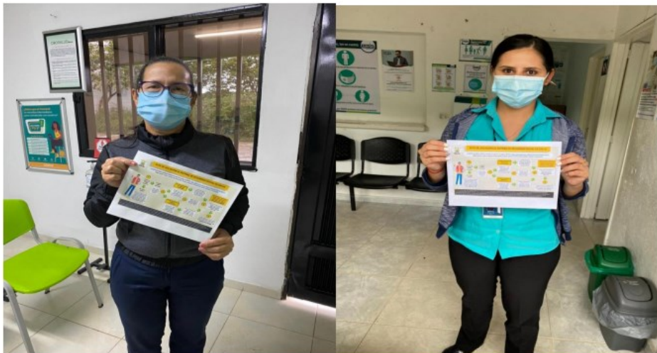
Socialización de la Ruta con las EPS Municipio COOSALUD Y SAVIA SALUD.